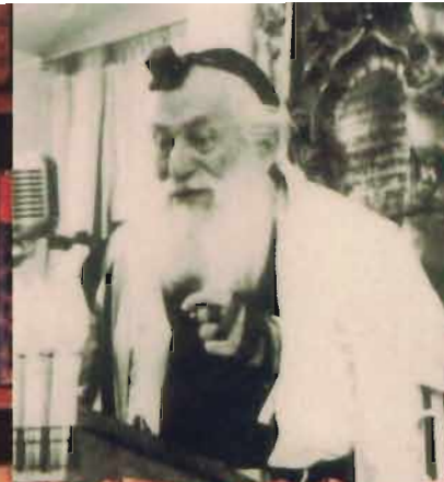
רבנו זצ"ל במקום שאחבה נפשו, בהיכל הישיבה