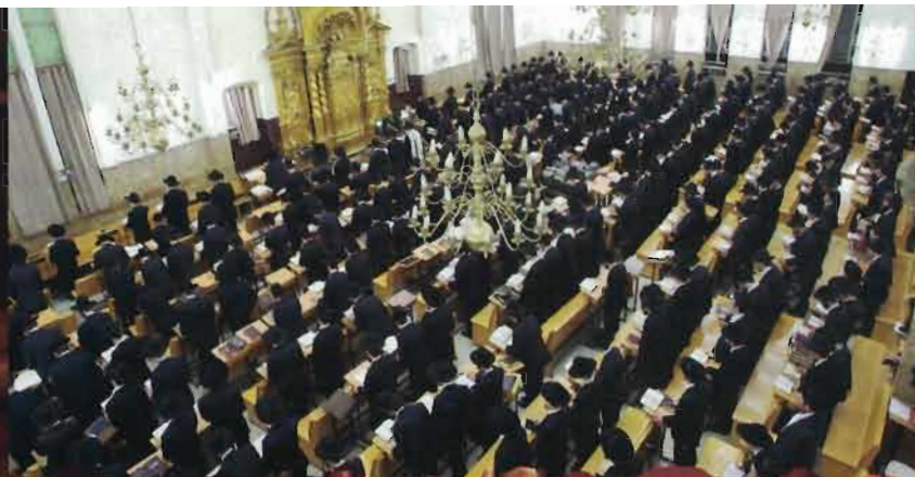
שיבת פוניבז' מבט מלבנים